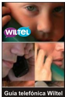
Guía telefónica Wiltel