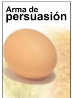
A ciencia cierta: Por G. Theler